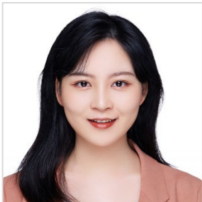
おんひん Wēn Pín 温嫔 (温嫔)