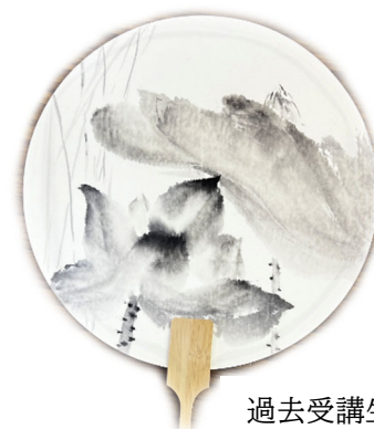
過去受講生の 作品