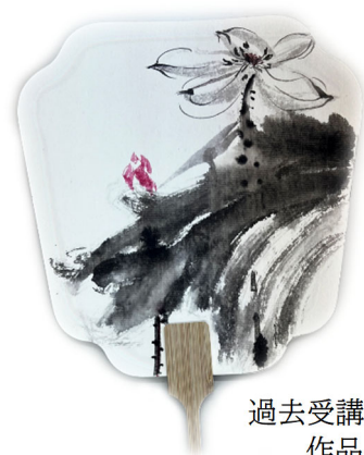
過去受講生の作品

APU 孔子学院は、受講生の皆様の個人情報に関しては、受講生本人へご連絡を差し上げる場合にのみ使用し、他の目的には一切使用いたしません。